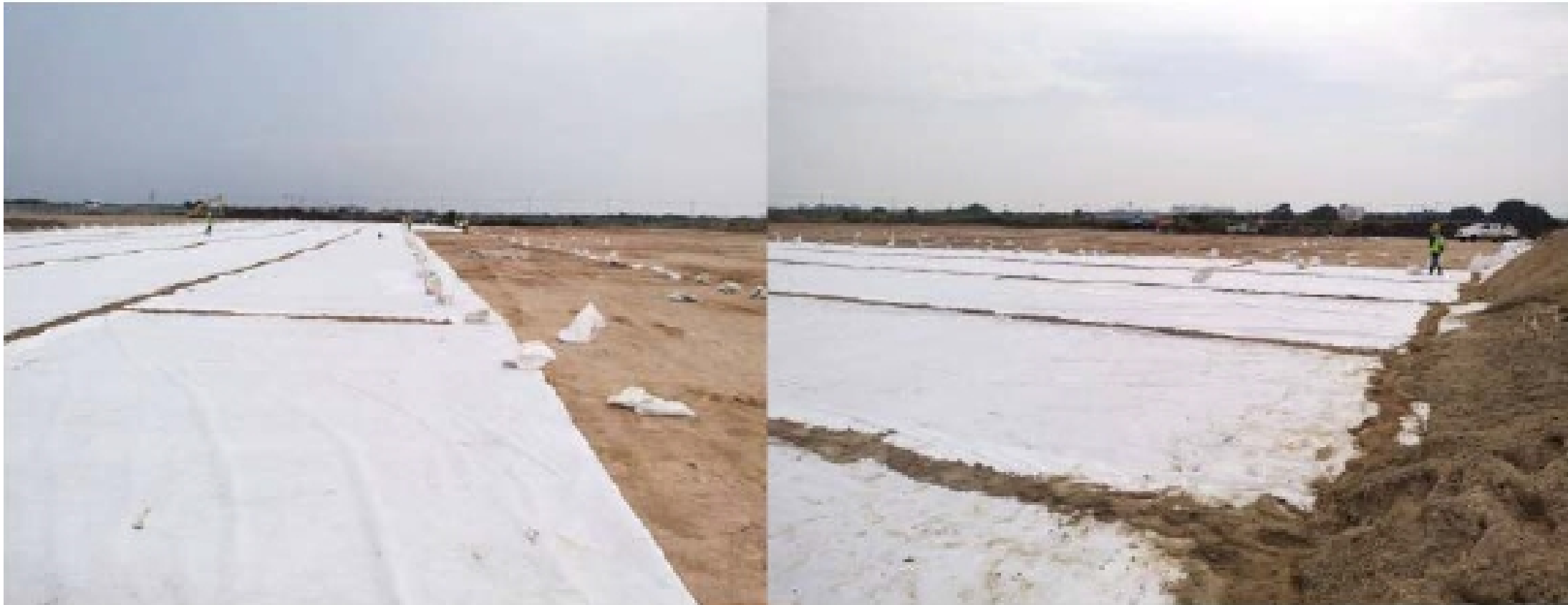
งาน Installation of Geotextile Perimeter Taxiway