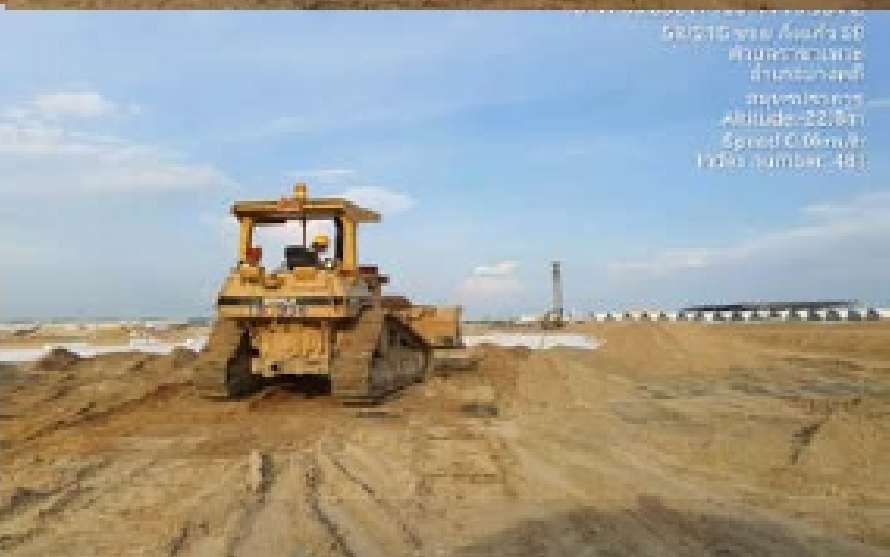
งาน Sand Blanket : North