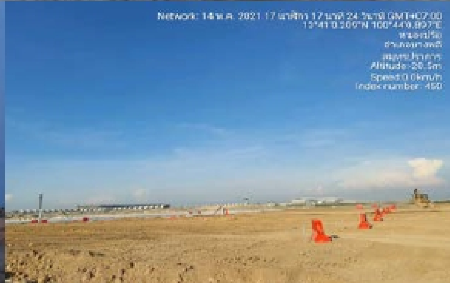
งาน Surcharge fill : North Area