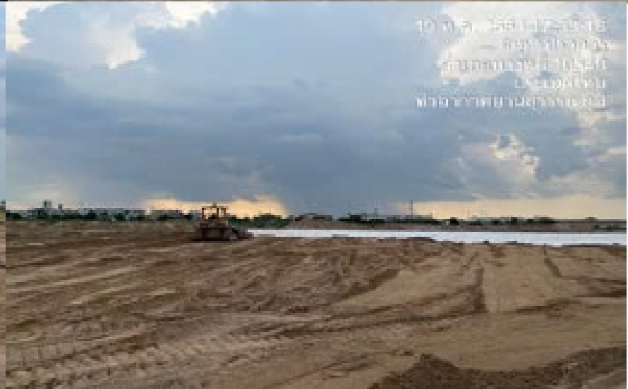
งาน Levelling Cut - Perimeter