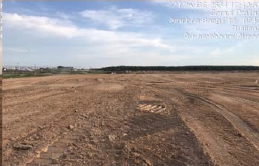
งาน Levelling fill - Perimeter