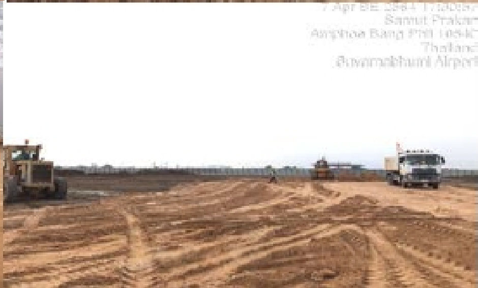
งาน Clearing – Perimeter