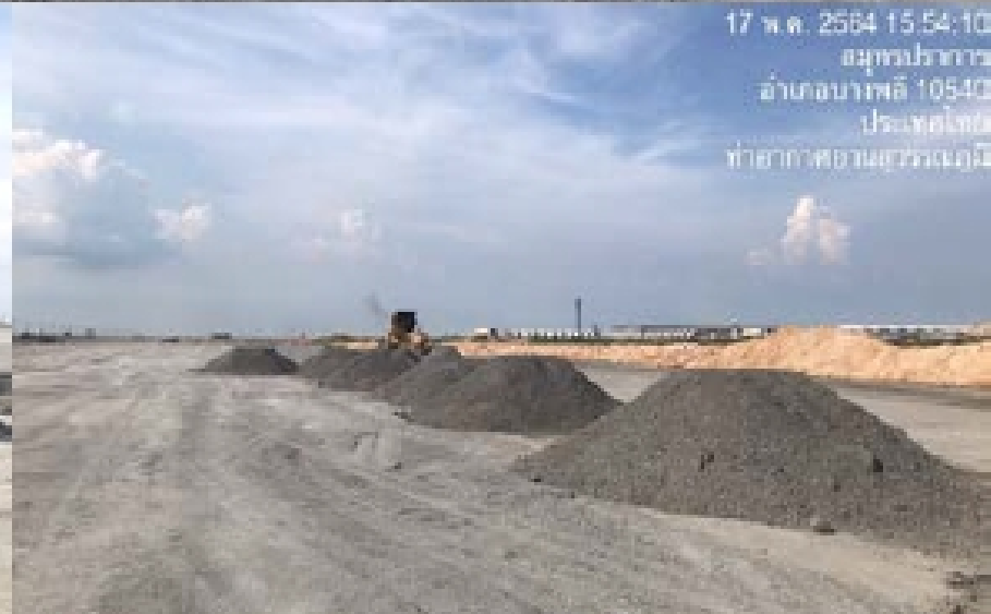
งาน Compacted existing subgrade CBR 6% : South