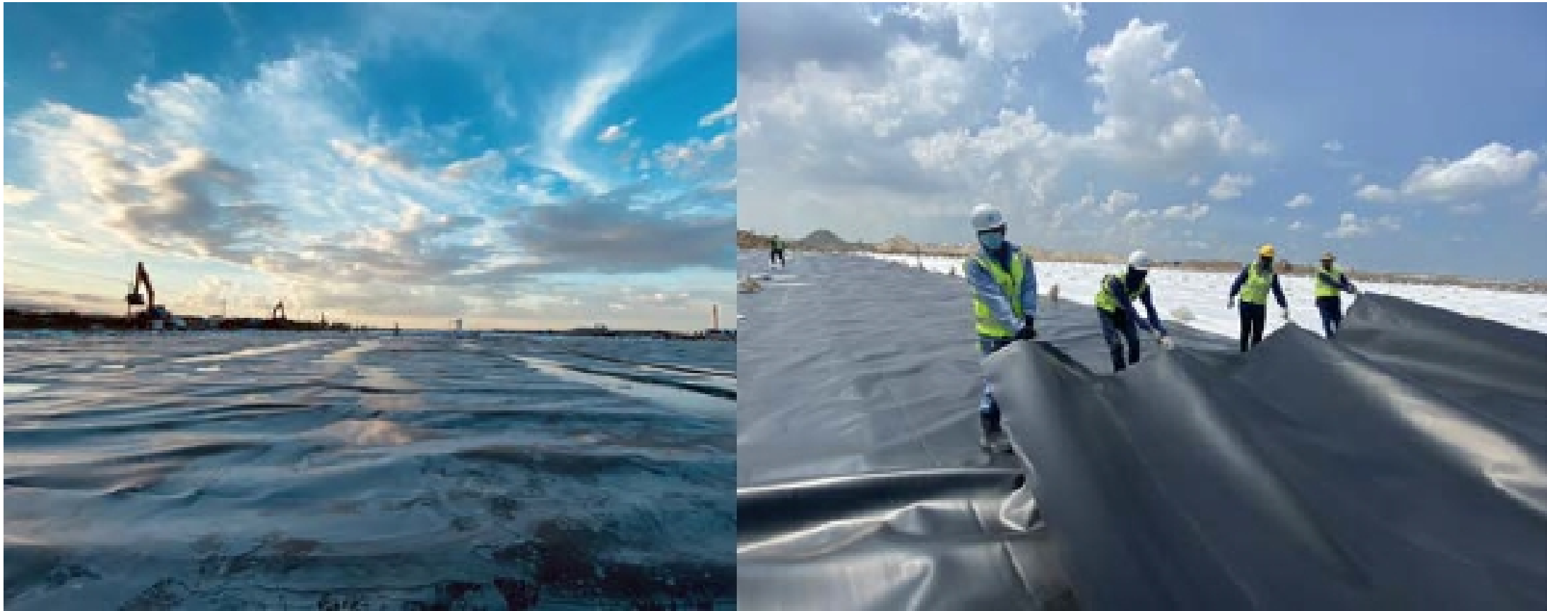
งาน Installation of Geomembrane