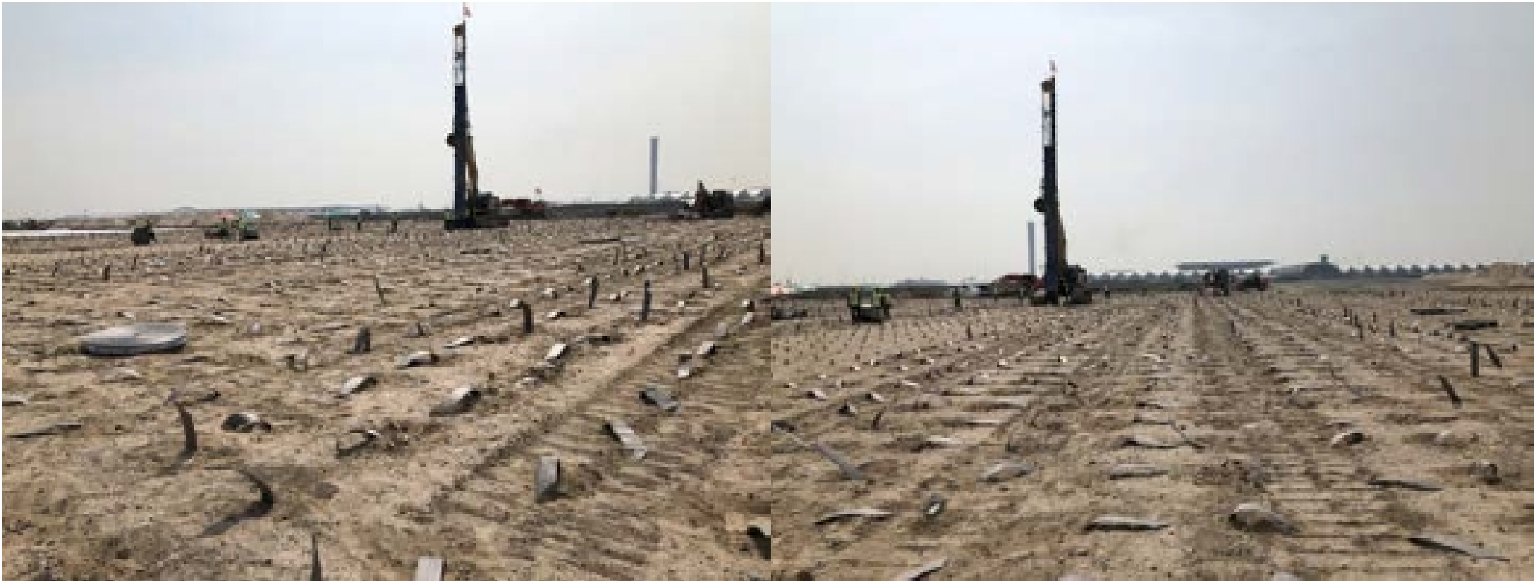
งาน Installation PVD : North Area