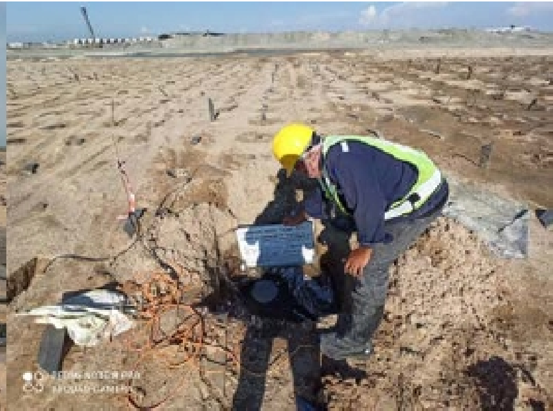
งาน Installation of monitoring Instrumentation