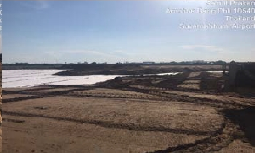
งาน Sand Blanket - Perimeter