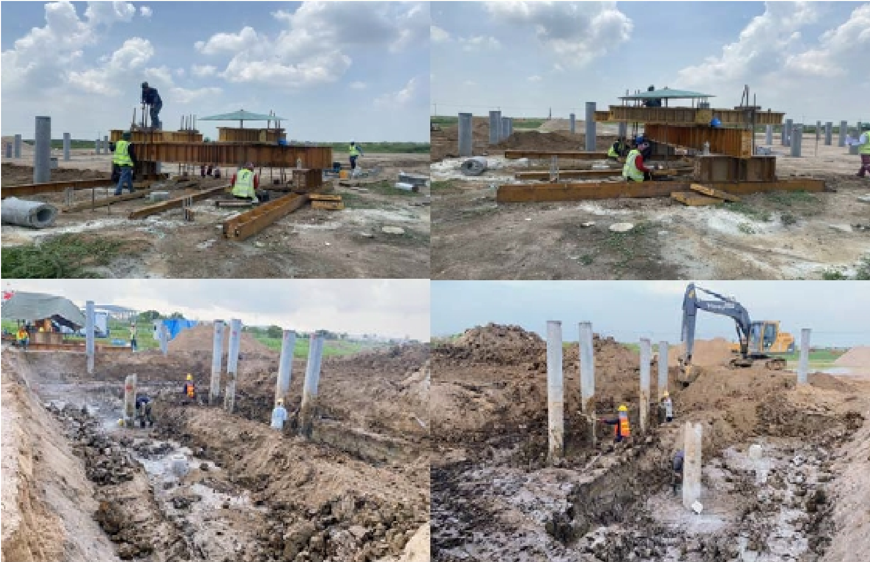
งาน Structural works AGL 02L