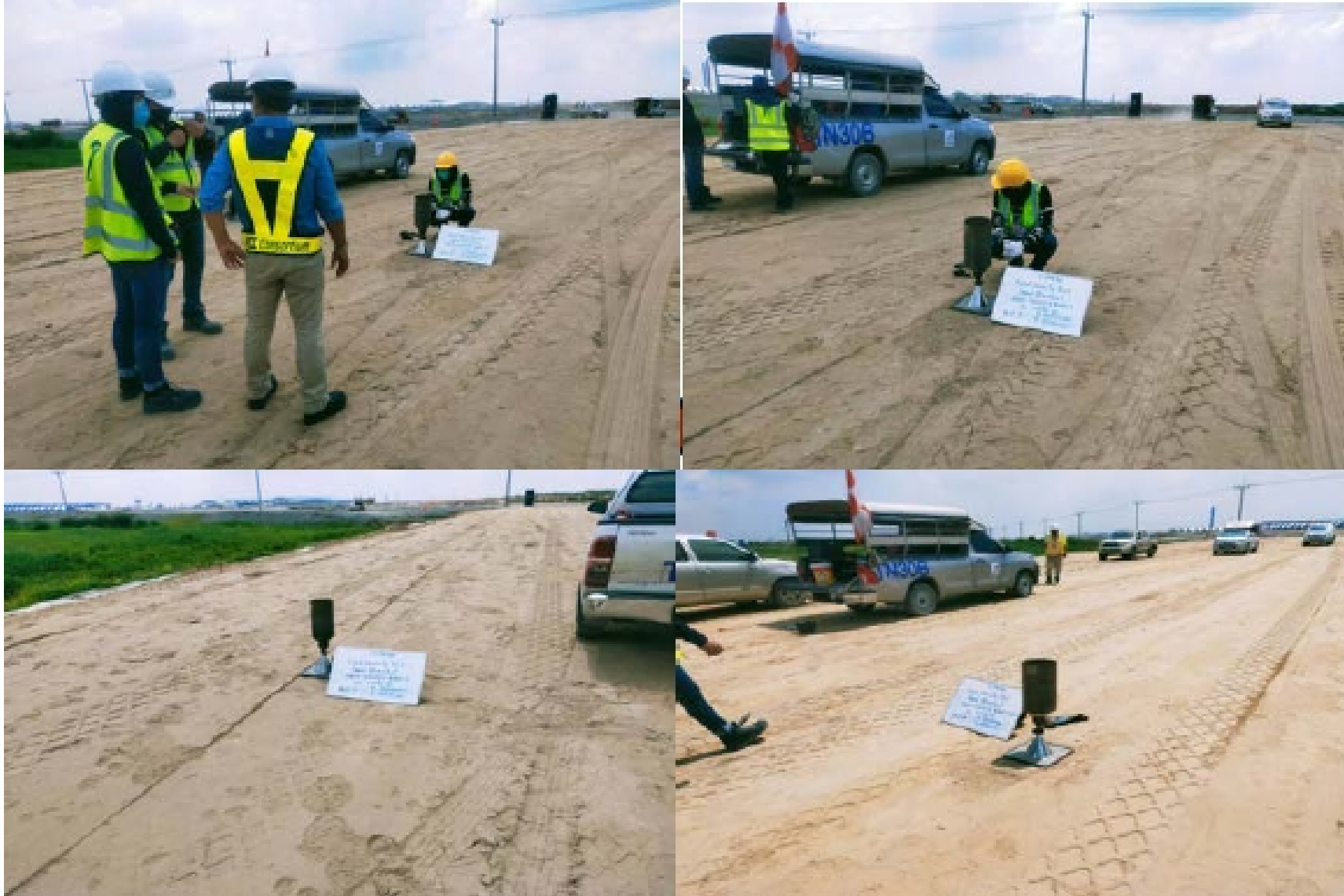
งาน Sand Blanket : ARFF