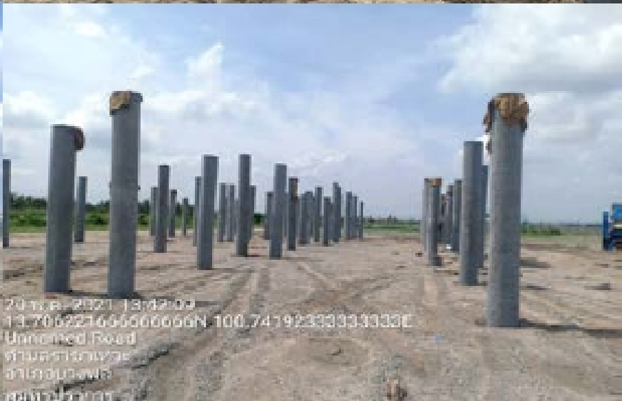
งาน Structural works